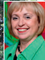
Prof. Dr. Maria Böhmer

„Frühlingsgefühle in der Haldmühle“ ist eine besondere Begegnung überaus interessanter Menschen aus Politik, Wirtschaft, Kunst und Kultur.